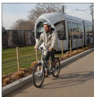
"Partager pour aller plus loin"