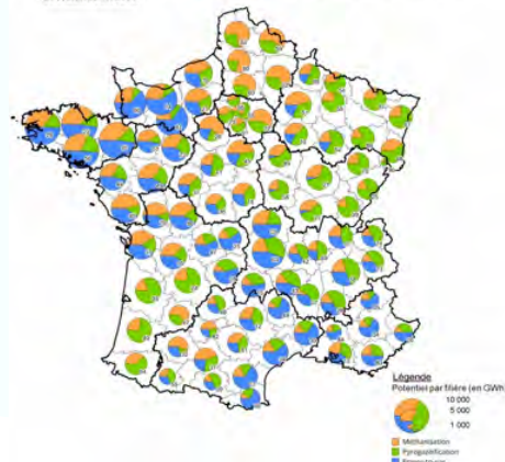
FIGURE 8 : RÉPARTITION DU POTENTIEL THÉORIQUE DE GAZ INJECTABLE PAR DÉPARTEMENT ET FILIÈRES EN 2050

460 TWh - En Bretagne, trois installations de méthanisation injectent du biométhane dans le réseau de gaz naturel pour 380 Nm 3 /h. Une dizaine de projets devraient rentrer en service prochainement