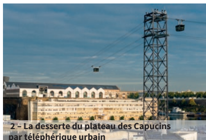
2 - La desserte du plateau des Capucins par téléphérique urbain