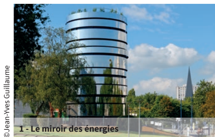
1 - Le miroir des énergies

En 2015-2016, Tinergie se complète par une filière « copropriété » s'appuyant sur le programme ville de demain PIA (aide aux travaux à hauteur de 35% pour le niveau BBC rénovation). Il lui sera confié une mission d'informer et d'accompagner des acteurs de la copropriété visant à déclencher la prise de décision de travaux, et de faire le lien avec les opérateurs locaux.