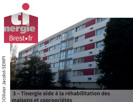
3 - Tinergie aide à la réhabilitation des maisons et copropriétés